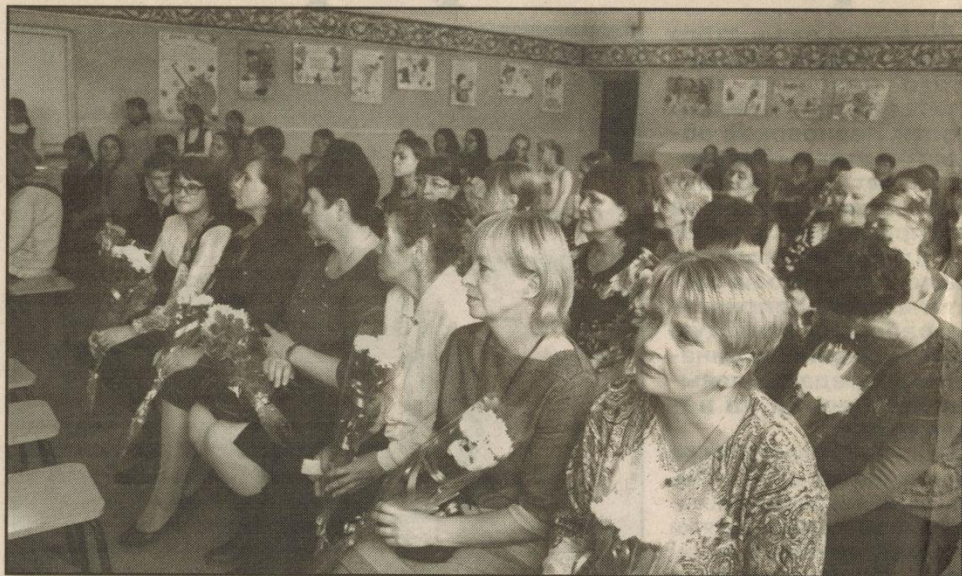
Зал расцвел от огромного количества цветов и улыбок

В актовом зале МБОУ Савинская СОШ прошел концерт, посвященный одному из самых вдохновенных и трогательных праздников – Дню учителя. В зале собрались педагоги школы, ветераны педагогического труда, ученики, выпускники и родители. Учащиеся школы подготовили замечательный концерт, который проводился в форме телепрограммы «School - TV». Веселые прямые включения из школьной жизни подарили всем собравшимся в зале хорошее настроение.