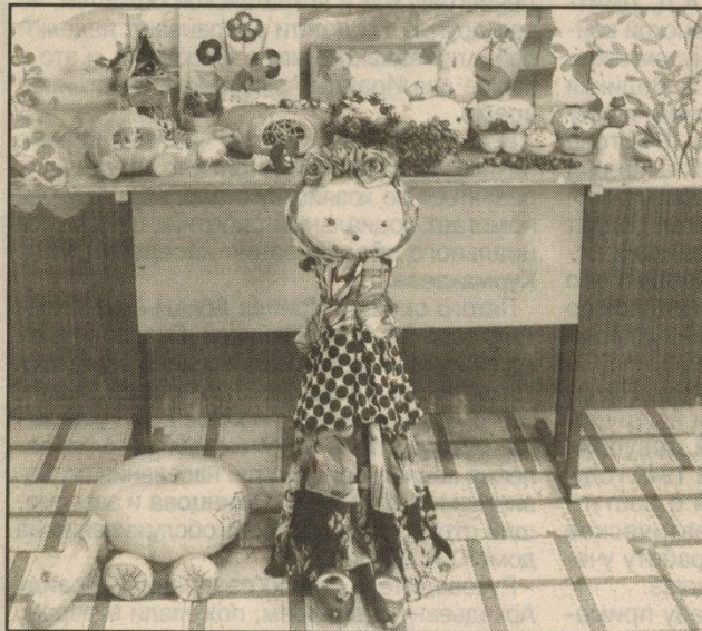
Поделки младших школьников из овощей и фруктов

Школьная осенняя ярмарка принесла много позитивных, ярких, незабываемых эмоций. Дети и взрослые с удовольствием продавали, покупали, шутили и радовались. Вот так, в игровой форме, ребята знакомятся с основными законами рынка.