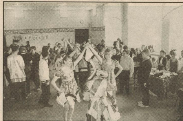
Веселись честной народ!

В здании начальной школы была организована выставка работ учащихся младших классов. Они вместе с родителями мастерили поделки из природных материалов, овощей и фруктов. И чего там только не было! Кареты и машины, чело-