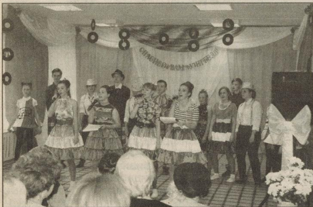
Это все для вас, дорогие учителя!